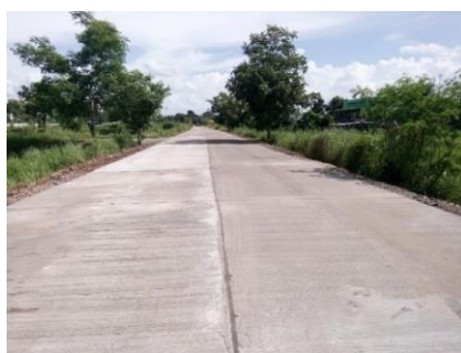
๑.๖ รอบเมือง-บ้านพอเพียง บ้านหัวคู หมู่ ๑ ใช้งบประมาณจำนวน ๔๙๒,๕๒๐ บาท