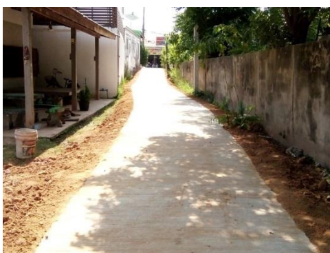
๑.๑๙ ซอยข้างบ้านนางจำเนียร สุวรรณแสง บ้านถ่อน หมู่ ๒ ใช้งบประมาณจำนวน ๑๖๘,๐๐๐ บาท