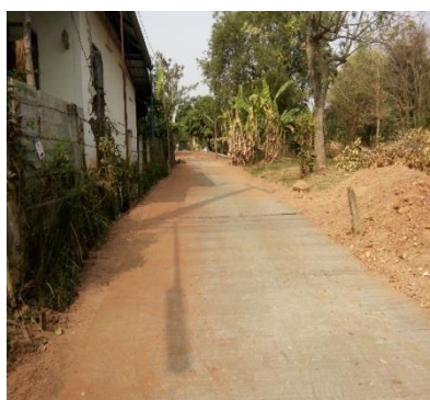
๑.๑๗ ซอยข้างสาธารณสุขอำเภอบ้านฝื่อ บ้านถ่อน หมู่ ๒ (ซอยตาลเดี่ยว) ใช้งบประมาณจำนวน ๒๗๒,๐๐๐ บาท