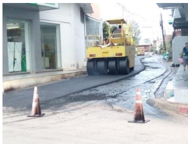
๒.๓ ถนนบุญเสมอบ้านหัวคู หมู่ ๑ กับบ้านศรีสำราญ หมู่ ๘ ใช้งบประมาณจำนวน ๔๙๑,๐๐๐ บาท