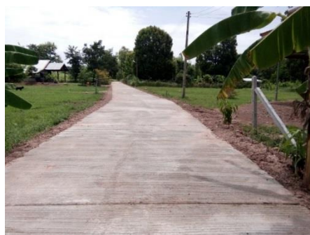
๑.๕ ถนนเฉลิมพระเกียรติ ชุมชนบ้านศรีสำราญ หมู่ ๘ ใช้งบประมาณจำนวน ๔๘๗,๐๐๐ บาท